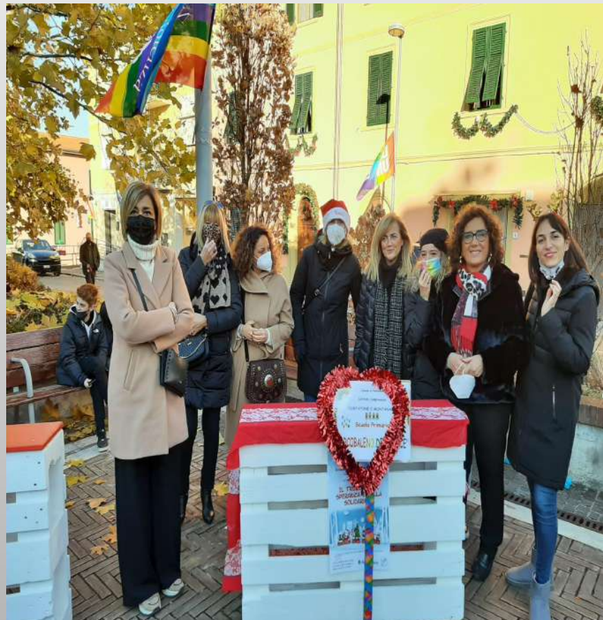
Il lancio dei palloncini